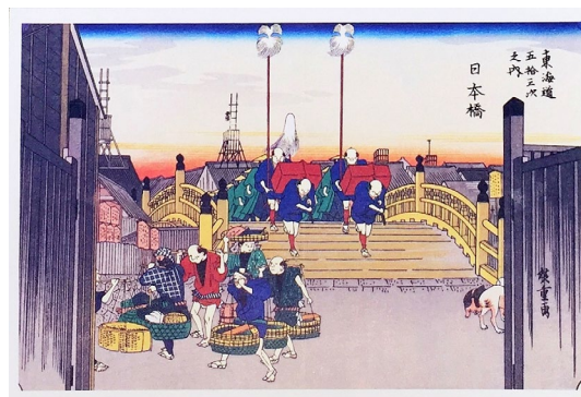
※広重の日本橋界限

1964年東京五輪整備で日本橋の上に重 く覆いかぶさった首都高速道路 —— 2018年に撤去署名の後押しを持って国 会での承認の元に、2021年とうとう 日本橋に青空が戻るようになりました。